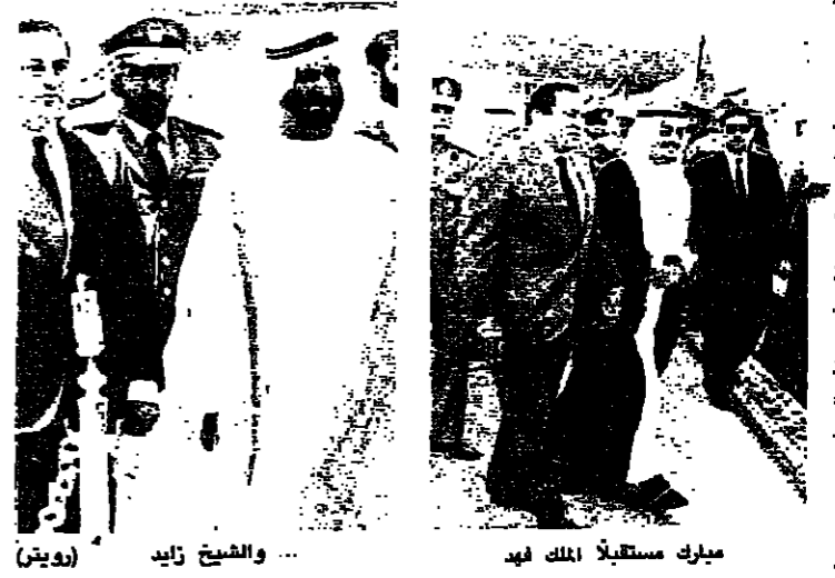
مبارك مستقبلاً الملك فهد... والشيخ زايد

رحب الرئيس المصري حسني مبارك أمس بوصول الزعماء العرب الى القاهرة في محاولة لخير لرفع العراق عن العدوان على الكويت. وتحاشي اندلاع حرب مع القوى الغربية المحتشدة في الخليج. وقد تم تأجيل مؤتمر القمة العربي الطارئ، الذي كان من المقرر عقده مساء أمس في اليوم، لإعطاء الوقت اللازم للوفود لتضييق فوه الخلافات عبر محادثات ثنائية. وقال مبعوث عربي ان مبارك يخطط لقمة عمل ترسل إشارة الى (الرئيس العراقي) صدام حسين، بأنه يزداد عزلة ساعة بعد أخرى. وتبقى عقبة واحدة ينبغي على مبارك اجتيازها قبل افتتاح أول قمة عربية تعقد في القاهرة منذ ٢٠ عاماً. فقد اخبر اعضاء وفد رويتر، ان امير الكويت المنفي الشيخ جابر الاحمد الصباح متردد في التفاوض مع الوفد العراقي، الذي يرثسه طه ياسين رمضان النائب الأول لرئيس الوزراء، ما دامت القوات العراقية باقية في الكويت. وفي تطور بارز، أعلن مصدر رسمي مطلع في القاهرة، ان نائب رئيس الوزراء العراقي طه ياسين رمضان ابلى الامانة للجمعة العربية، رفضه للمشاركة في قمة يشترك فيها امير الكويت او اي من اعضاء حكومته. على أساس ان دولة الكويت قد أصبحت الآن جزءاً من الدولة العراقية، بعد الاتفاق الودي الذي أعلنه أخيراً.